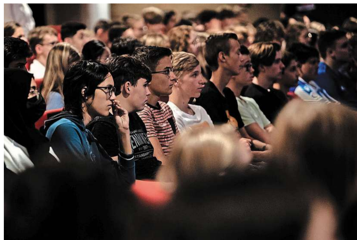
304 vierdejaars van het Kennemer College luisterden ademloos naar de lezing over klimaatverandering.

Hoofredacteur: Corine de Vries, Jan 't Hart (adjunct) en Gerben van 't Hek (adjunct) Secretariaat: redactiesecretariaat@mediahuis.nl Hoofdkantoor: Mediahuis Nederland B.V. Basisweg 30, 1043 AP Amsterdam 088 - 8249111 Redactiechef: Annemiek Jansen Regiokantoor: Stationsplein 2, 1948 LB Beverwijk redactie@ijmuidercourant.nl, tel. 0255-561800 redactie.ken@nhd.nl, tel. 0251-207620 Online: www.ijmuidercourant.nl Twitter @ijmuidercourant facebook.com/IJmuidercourant www.nhd.nl Twitter @nhdagblad facebook.com/NHD - Dagblad Kennemerland Raad voor de Journalistiek: IJmuider Courant en Dagblad Kennemerland volgen de leidraad van de Raad voor de Journalistiek. Ga naar: rvdj.nl. Vragen van abonnees: Voor bezorgklachten of vragen over abonnement: mijn.ijmuidercourant.nl mijn.noordhollandsdagblad.nl, bel Klantenservice, 088 - 8241111 of maak gebruik van onze WhatsApp-service op 072-5184020. Openingstijden: Werkdagen: 08.00 - 17.00 uur Zaterdag: 08.00 - 11.00 uur Advertentie opgeven: samenwerken@mediahuis.nl Familieberichten: 088 - 8240135 of familieberichtenopinternet.nl. Rechtenvoorbehoud: Alle rechten t.a.v. deze uitgave worden uitdrukkelijk voorbehouden en berusten bij Mediahuis Nederland B.V. Op het gebruik van deze uitgave is het bepaalde in de algemene gebruiksvoorwaarden van Mediahuis Nederland van toepassing: mediahuis.nl/gebruiksvoorwaarden. ©Mediahuis Nederland B.V., 2020