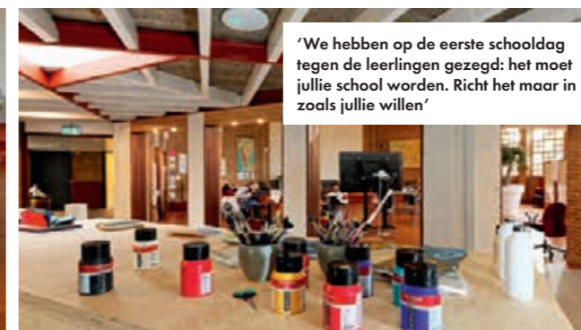
'We hebben op de eerste schooldag tegen de leerlingen gezegd: het moet jullie school worden. Richt het maar in zoals jullie willen'