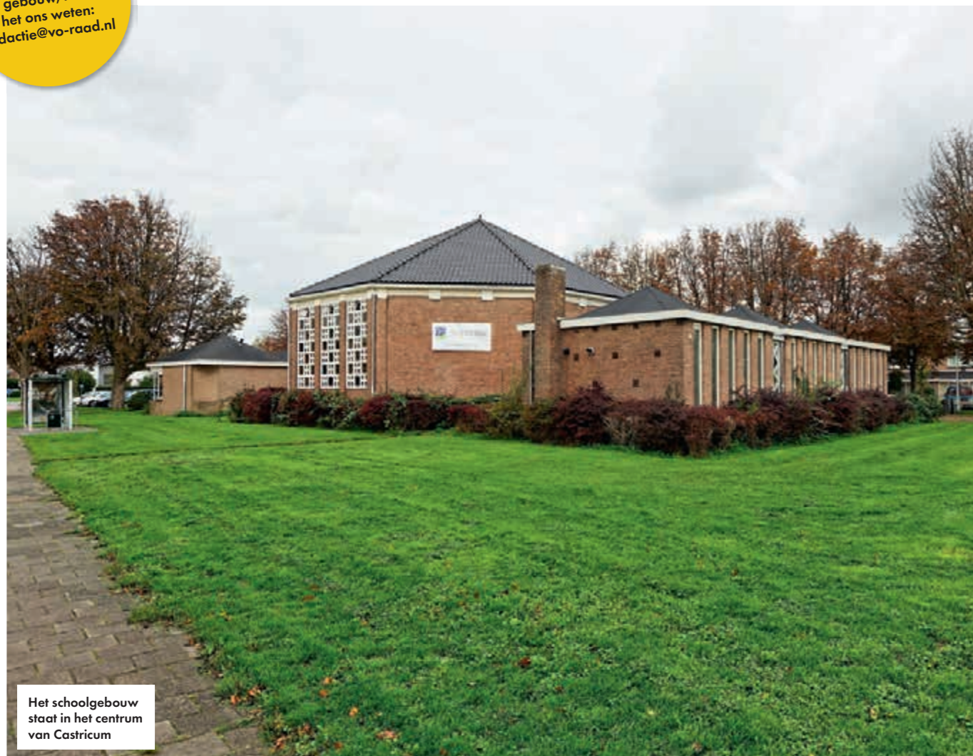
Het schoolgebouw staat in het centrum van Castricum

Heeft u ook een bijzonder gebouw, laat het ons weten: redactie@vo-raad.nl