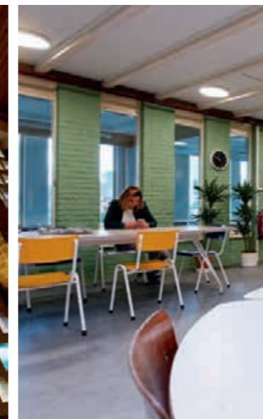
'Om te zorgen voor een prettige onderwijsomgeving hebben we gezorgd voor meer licht. En voor kleur op de muren'