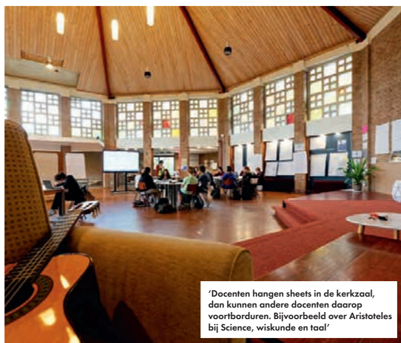
'Docenten hangen sheets in de kerkzaal, dan kunnen andere docenten daarop voortborduren. Bijvoorbeeld over Aristoteles bij Science, wiskunde en taal'